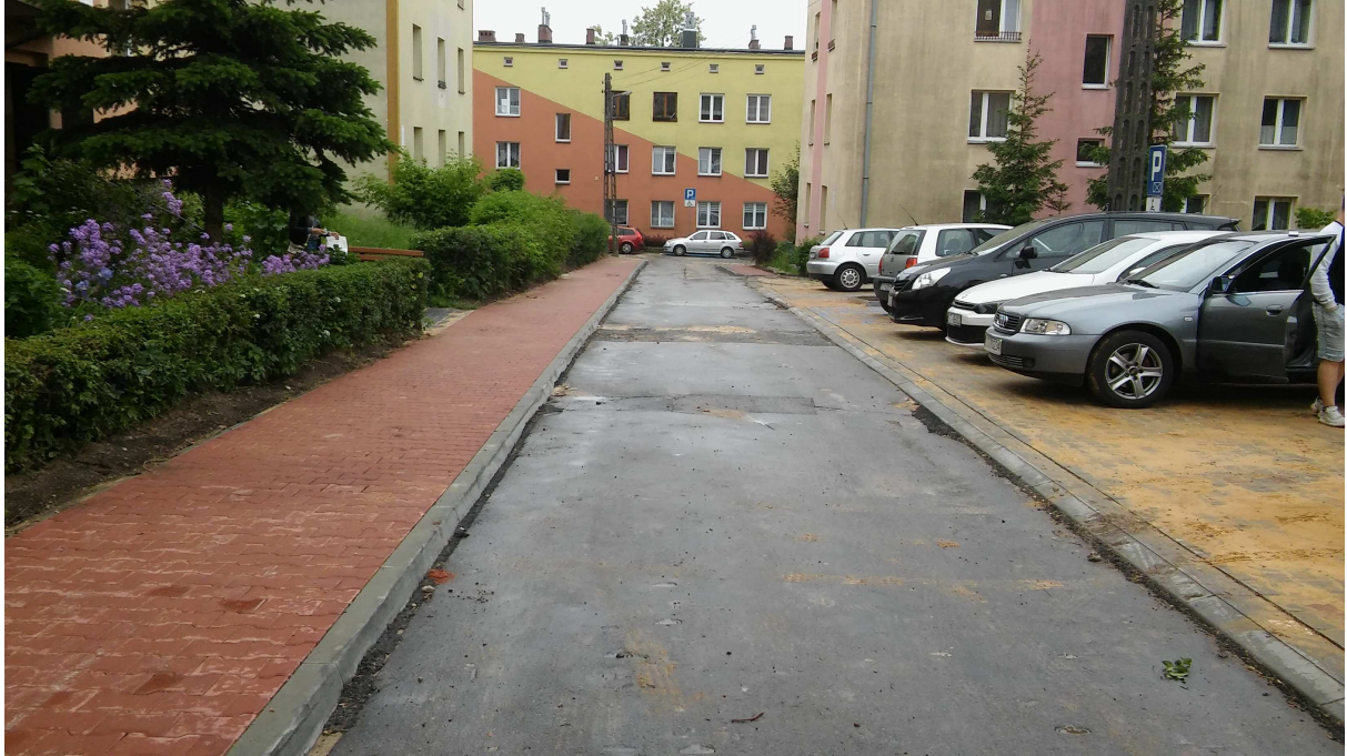
Zdjęcie nr Nowe miejsca postojowe i chodnik przy ul Kochanowskiego

Dwa pozostałe projekty tj.: „Budowa tężni solankowej”. Jako pierwszy w Starachowicach „Mały Ciechocinek” oraz Budowa skateparku w centralnej części miasta Starachowice - plac „Pod Skałkami” zostały zaplanowane do realizacji w latach przyszłych.